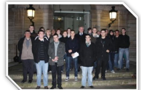
Les élèves de la classe de seconde G et T